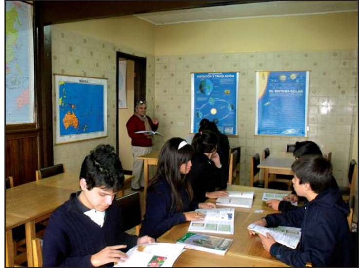
Liceo de Quilpué